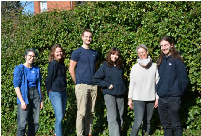
Tutor*innen (und Inske) im Sommersemester 2024

Betreut nun schon seit einigen Jahren die Einstiegsphase des Studiums und stets engagiert, uns erfolgreich durch das Studium zu navigieren! :)