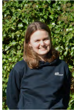
Freia - EN

Immer gut gelaunt und bei jedem Spaß dabei!