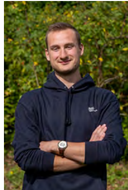
Noah - ET

Niko ist sehr hilfsbereit und unterstützt nun das erste Mal auch im Sommer.